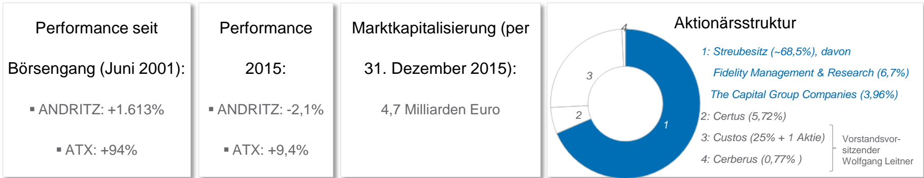
Relative Kursentwicklung der ANDRITZ-Aktie im Vergleich zum ATX seit IPO